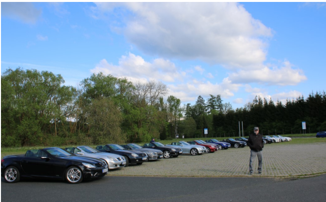
Die Aufnahme entstand auf einem Großparkplatz an der Grenze zwischen Tschechien und Bayern

Am Samstag, dem 4. Mai, trafen sich 17 Autos dieses Typs beim Startpunkt Monte Kaolino in Hirschau. Zwei-